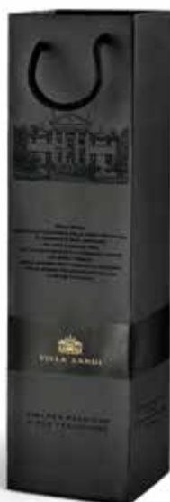
Cod. 857 - Shopper da 1 bottiglia Fardo da 12