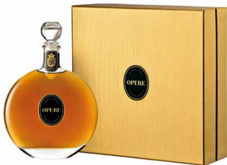
Cod. 848 - Cofanetto gioiello Grappa Opere Riserva 10 anni 50 cl - Fardo da 3