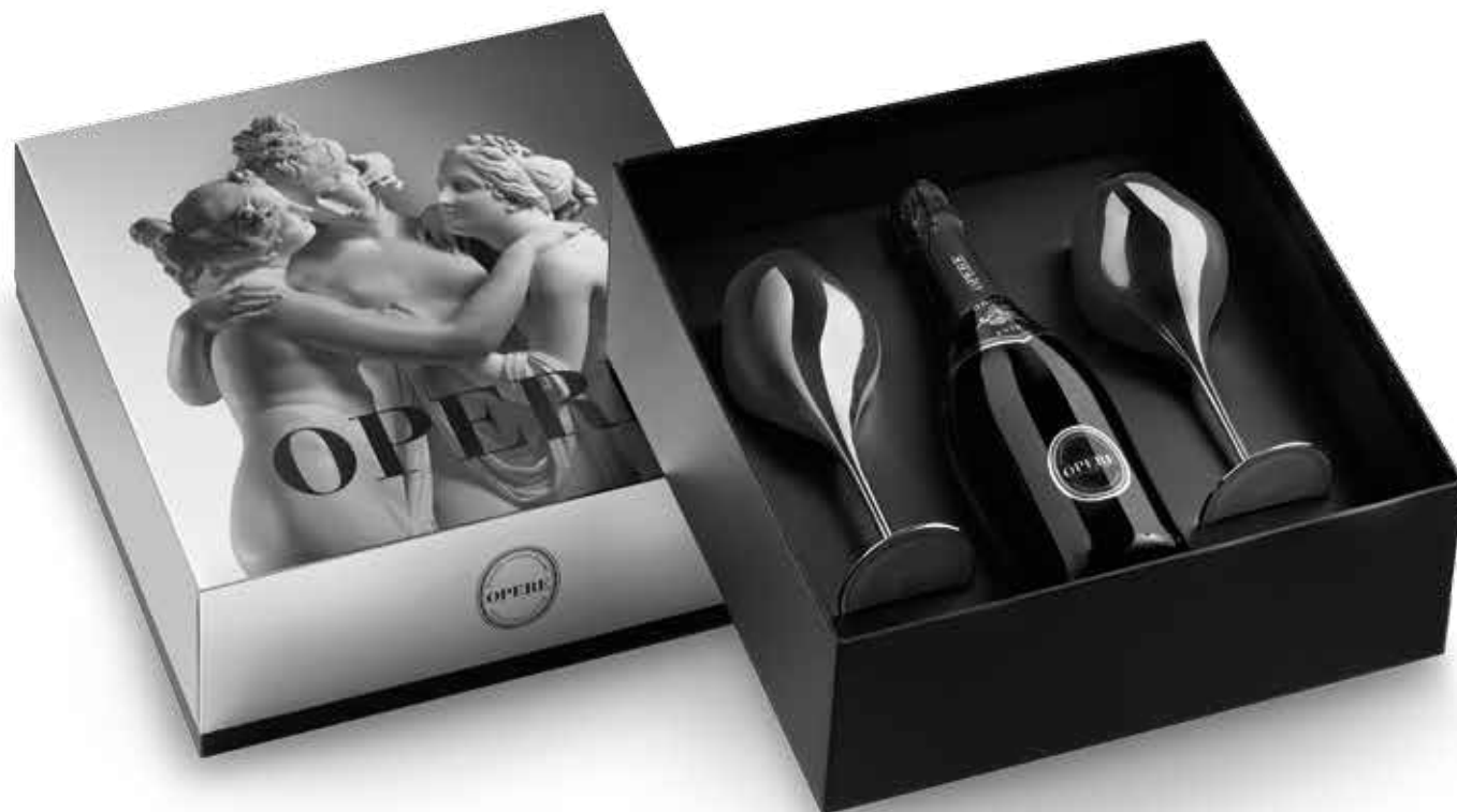
Cod. 843 - Confezione con 2 calici argento, Opere Extra Brut - Fardo singolo