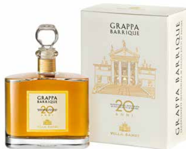
Cod. 172 - Astuccio da 1 bottiglia Grappa Marinali gioiello 20 anni 50 cl - Fardo da 3