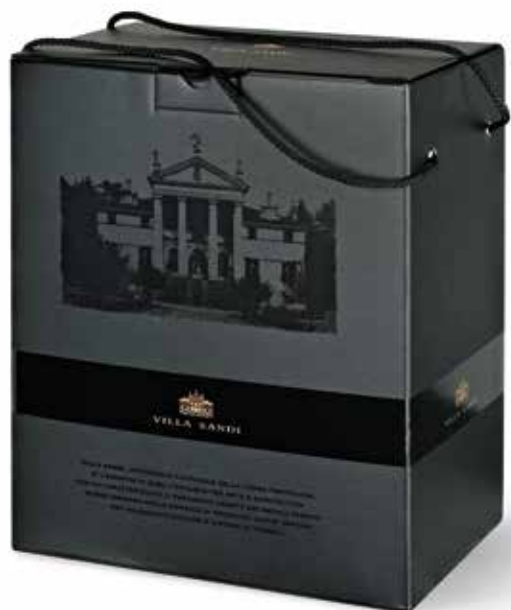
Cod. 910 - Box "enoteca" da 6 bottiglie Fardo da 6