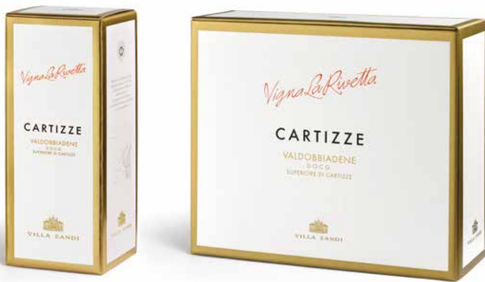
Cod. 825 - Astuccio "Vigna la Rivetta" da 1 bottiglia - Fardo da 6 Cod. 850 - Cofanetto "Vigna la Rivetta" da 2 bottiglie - Fardo da 3