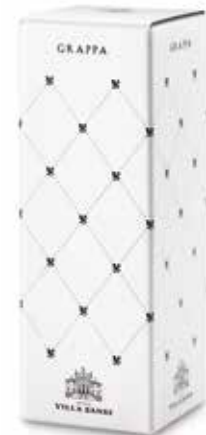
Cod. 877 - Astuccio Grappa Villa Sandi da 1 bott. 70 cl - Fardo da 6