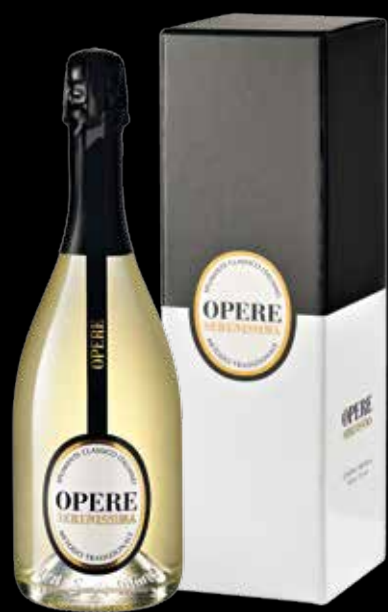
Cod. 077 - Astuccio con bottiglia Opere Serenissima 1,5 lt - Fardo singolo