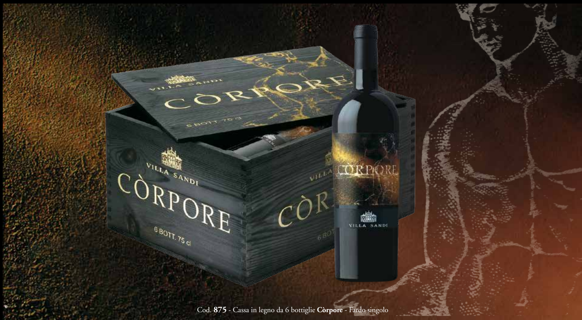
Cod. 875 - Cassa in legno da 6 bottiglie Còrpore - Fardo singolo