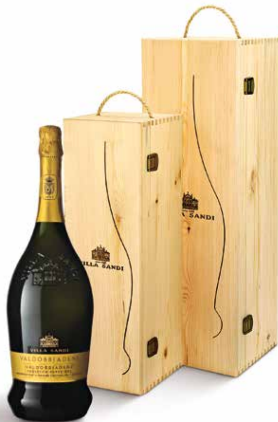
Cod. 837 - Cassa in legno Valdobbiadene DOCG Extra Dry Magnum 1,5 lt - Fardo singolo / Cod. 826 - Cassa in legno Valdobbiadene DOCG Extra Dry Jeroboam 3 lt - Fardo singolo