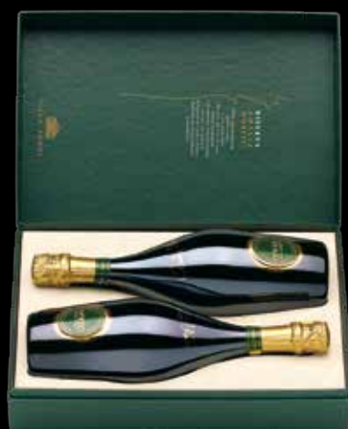
Cod. 874 - Cofanetto da 2 bottiglie Opere Riserva Amalia Moretti - Fardo singolo