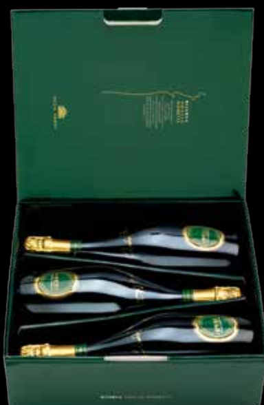
Cod. 805 - Cofanetto da 3 bottiglie Opere Riserva Amalia Moretti - Fardo singolo