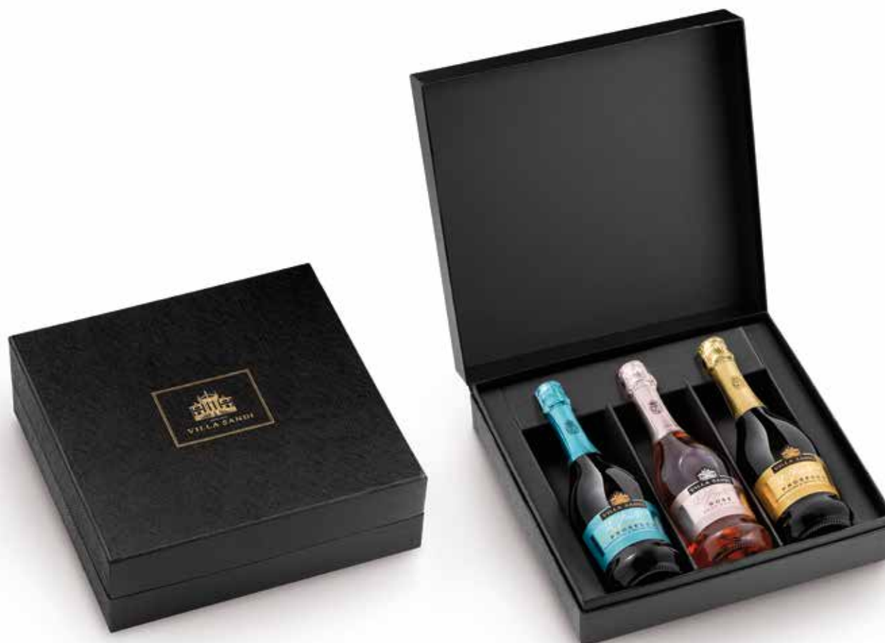
Cod. 895 - Cofanetto da 3 bottiglie "il Fresco" Prosecco Millesimato, Rosé, Prosecco DOC - Fardo singolo