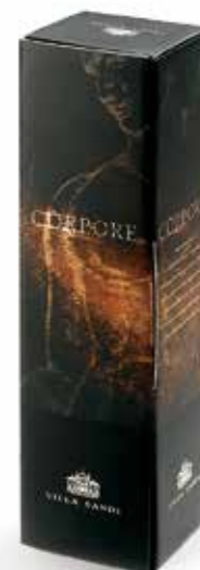
Cod. 898 - Astuccio Còrpoře da 1 bottiglia Fardo da 6