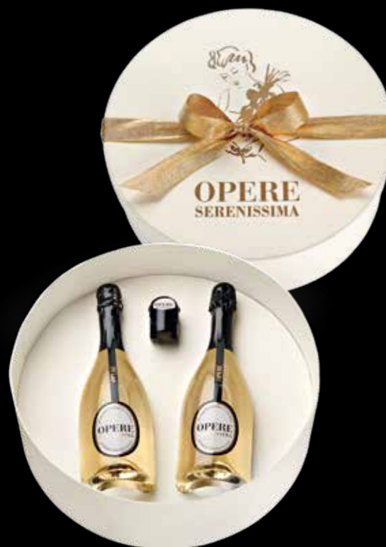
Cod. 822 - Cappelliera da 2 bottiglie con stopper Opere Serenissima - Fardo singolo