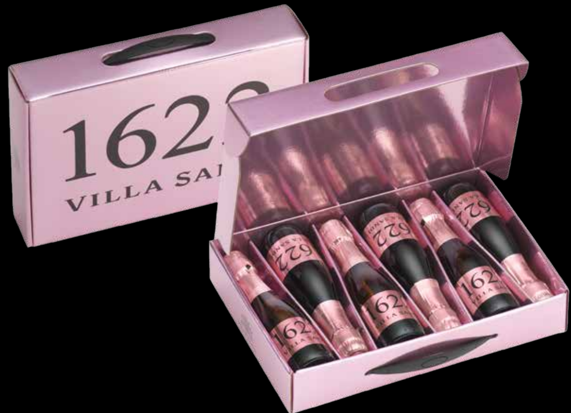
Cod. 881 - Valigetta 6 bottiglie 1622 Rosato 0,20 l. - Fardo singolo