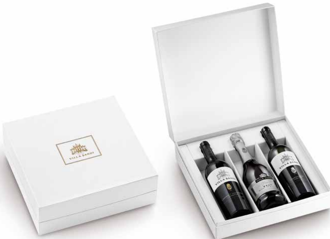
Cod. 896 - Cofanetto da 3 bottiglie Blanc de Blancs, Chardonnay DOC, Cabernet Sauvignon DOC - Fardo singolo