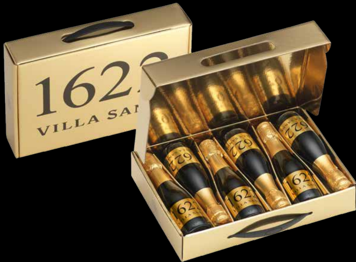
Cod. 892 - Valigetta 6 bottiglie 1622 Prosecco 0,20 l. - Fardo singolo