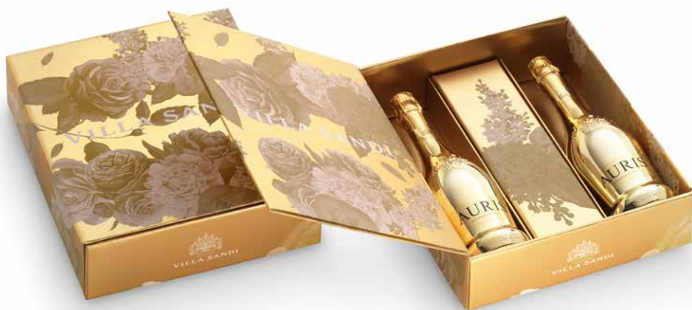
Cod. 863 - Cofanetto fiori oro 2 bottiglie Auris Spumante - Fardo singolo