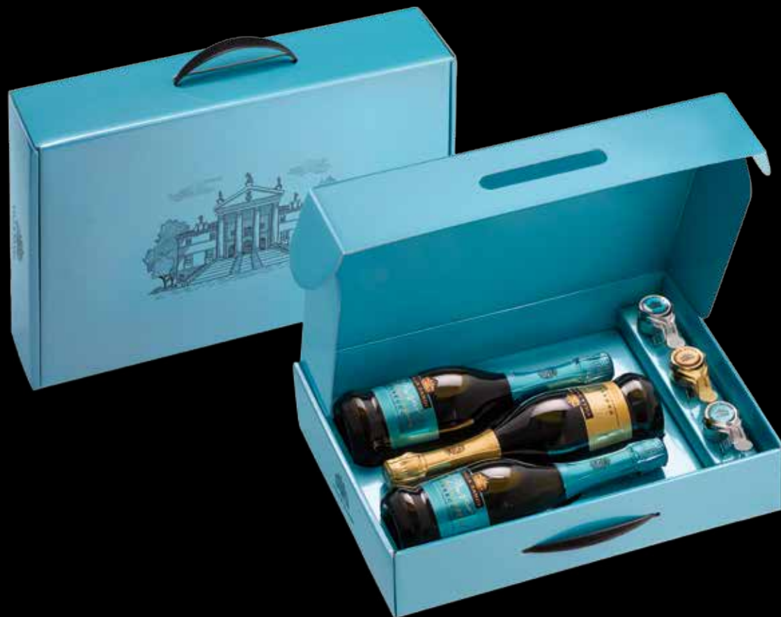
Cod. 884 - Valigetta da 3 bottiglie con stopper, Prosecco DOC Treviso Millesimato "il Fresco", Prosecco DOC Treviso "il Fresco" - Fardo singolo