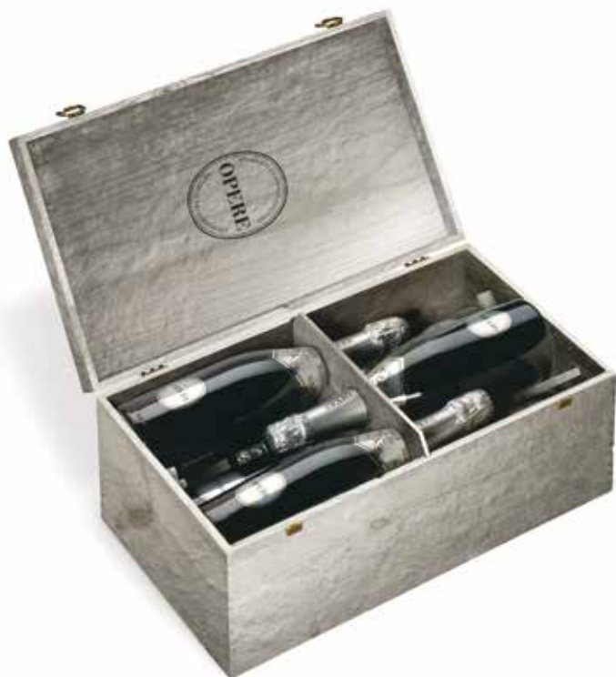
Cod. 862 - Cassa in legno argento da 6 bottiglie Opere Brut - Fardo singolo