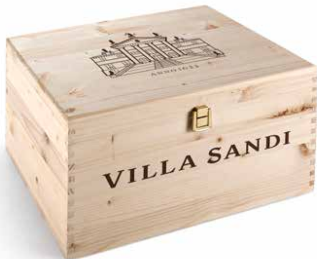
Cod. 882 - Cassa legno da 6 bottiglie Fardo singolo