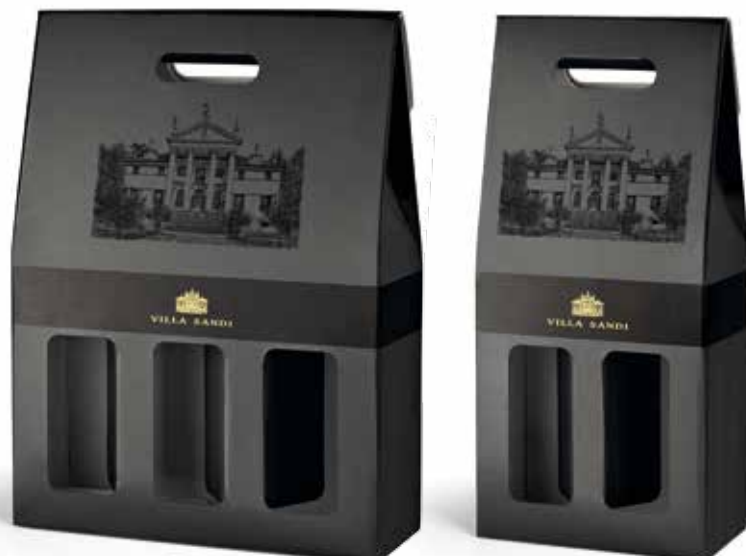
Cod. 860 - Confezione da 3 bottiglie - Fardo da 6 Cod. 869 - Confezione da 2 bottiglie - Fardo da 12