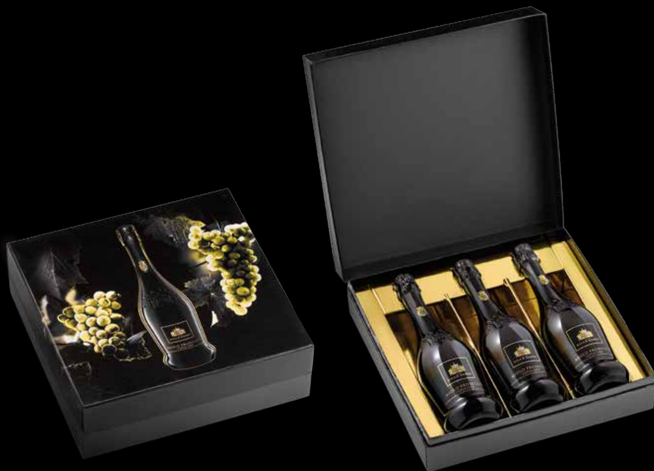
Cod. 886 - Cofanetto da 3 bottiglie Asolo Prosecco Superiore DOCG - Fardo singolo