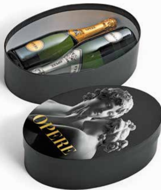
Cod. 885 - Cappelliera da 2 bottiglie Opere Brut e Millesimato - Fardo singolo