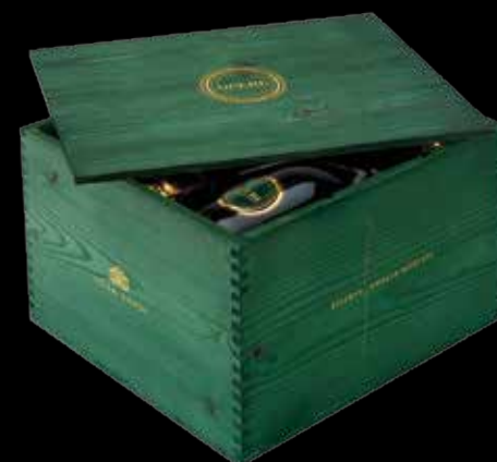
Cod. 078 - Cassa in legno da 6 bottiglie Opere Riserva Amalia Moretti - Fardo singolo