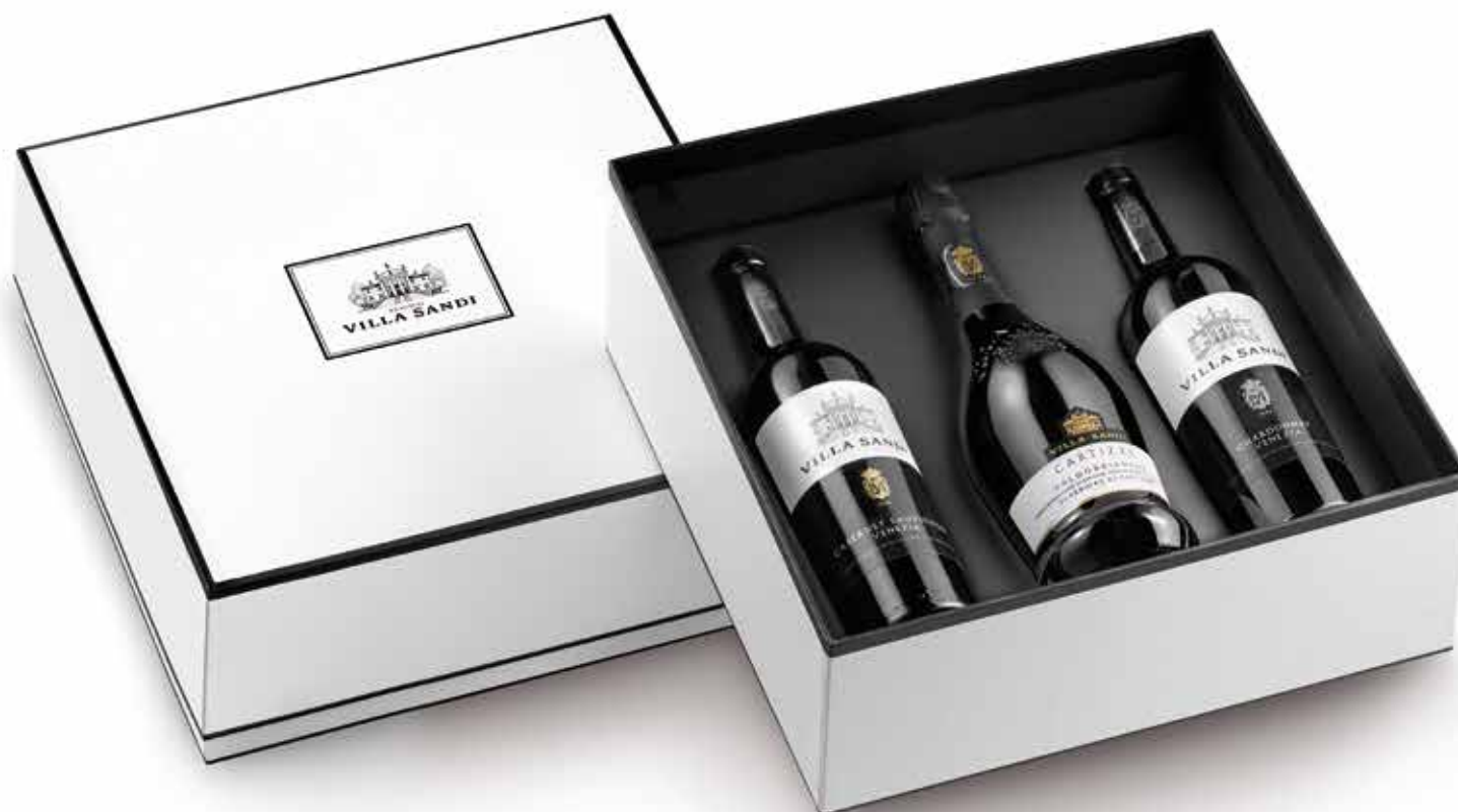
Cod. 883 - Confezione da 3 bottiglie Chardonnay DOC, Valdobbiadene Superiore di Cartizze DOCG Dry, Cabernet Sauvignon DOC - Fardo singolo