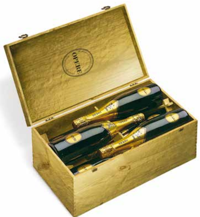
Cod. 802 - Cassa in legno oro da 6 bottiglie Opere Millesimato - Fardo singolo