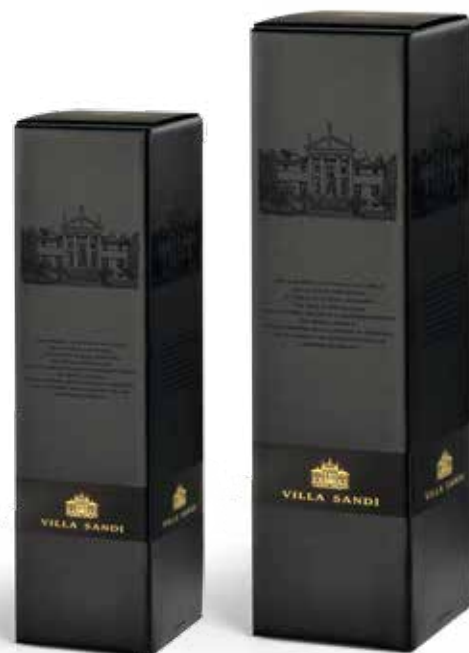
Cod. 858 - Astuccio da 1 bottiglia - Fardo da 12 Cod. 852 - Astuccio da 1 bottiglia 1,5 lt - Fardo da 6