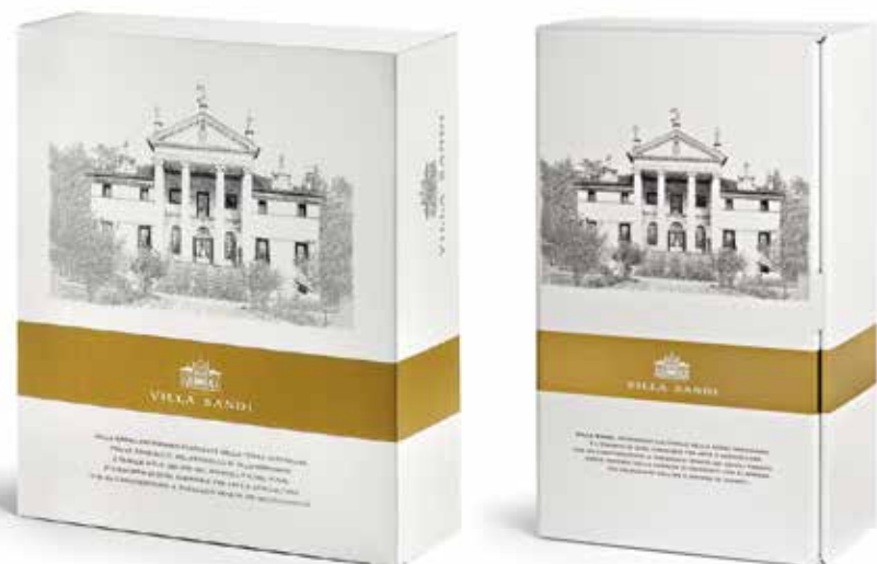
Cod. 887 - Cofanetto da 3 bottiglie - Fardo da 4 Cod. 842 - Cofanetto da 2 bottiglie - Fardo da 6