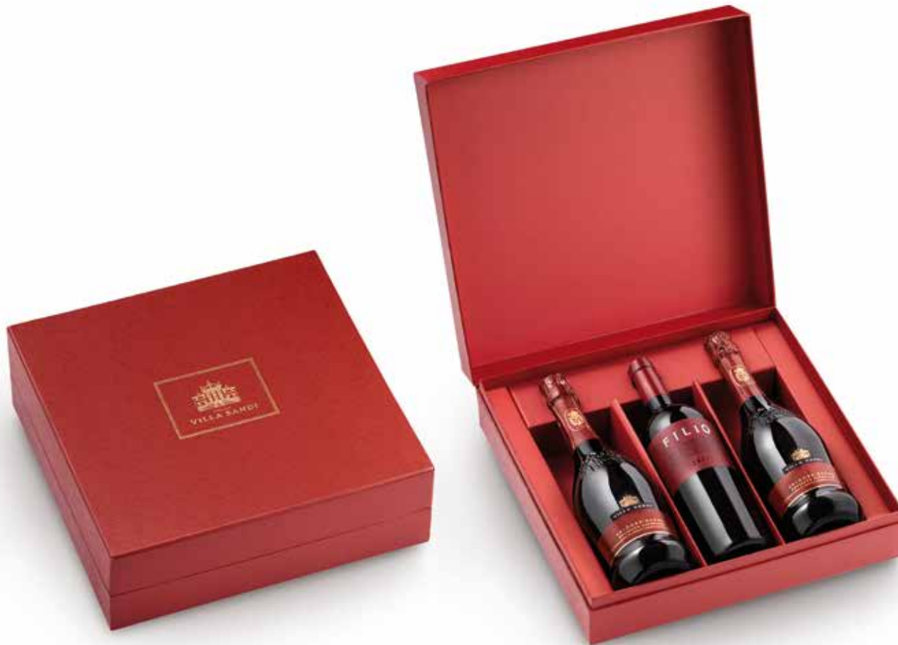
Cod. 889 - Cofanetto da 3 bottiglie Valdobbiadene DOCG Rive di San Pietro di Barbozza, Filio - Fardo singolo