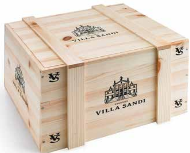
Cod. 893 - Cassa legno da 6 bottiglie bordolesi Fardo singolo