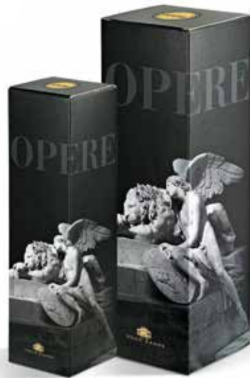
Cod. 804 - Astuccio Opere da 1 bott. - Fardo da 12 Cod. 855 - Astuccio Opere da 1 bott. 1,5 lt - Fardo da 6