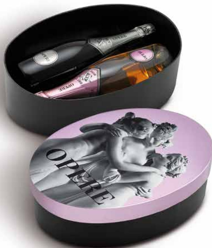
Cod. 841 - Cappelliera da 2 bottiglie Opere Brut e Rosé - Fardo singolo