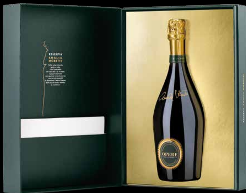
Cod. 806 - Cofanetto da 1 bottiglia Opere Riserva Amalia Moretti con pinza - Fardo singolo