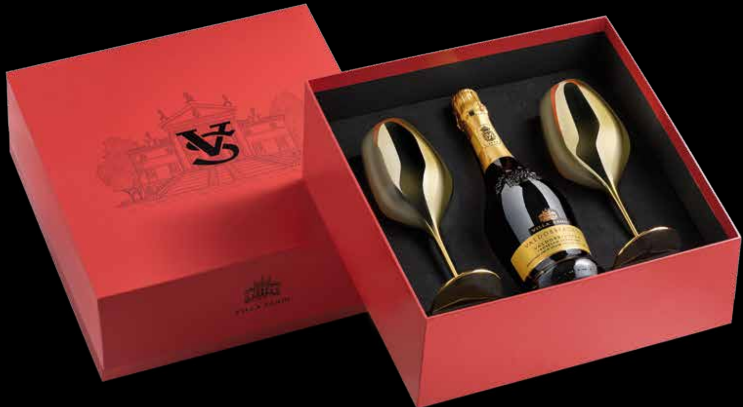
Cod. 830 - Confezione con 2 calici oro, Valdobbiadene DOCG Extra Dry - Fardo singolo