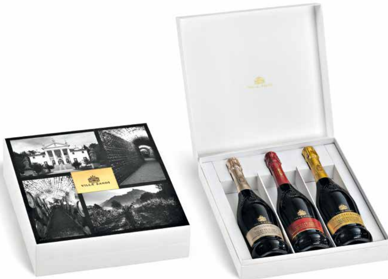
Cod. 835 - Cofanetto da 3 bottiglie Valdobbiadene DOCG Millesimato, Valdobbiadene DOCG Rive di San Pietro di Barbozza, Valdobbiadene DOCG Extra Dry - Fardo singolo