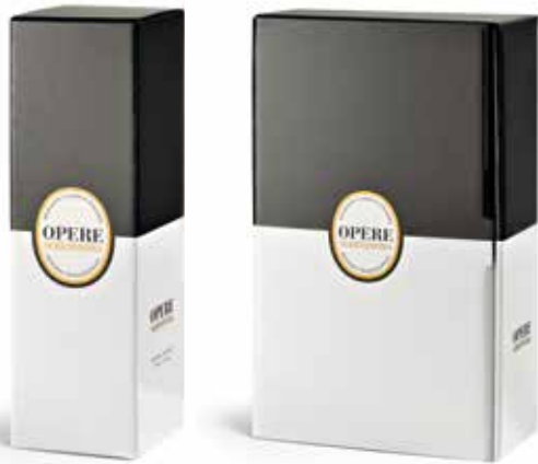
Cod. 856 - Astuccio Opere Serenissima da 1 bott. - Fardo da 6 Cod. 814 - Cofanetto Opere Serenissima da 2 bott. - Fardo da 3