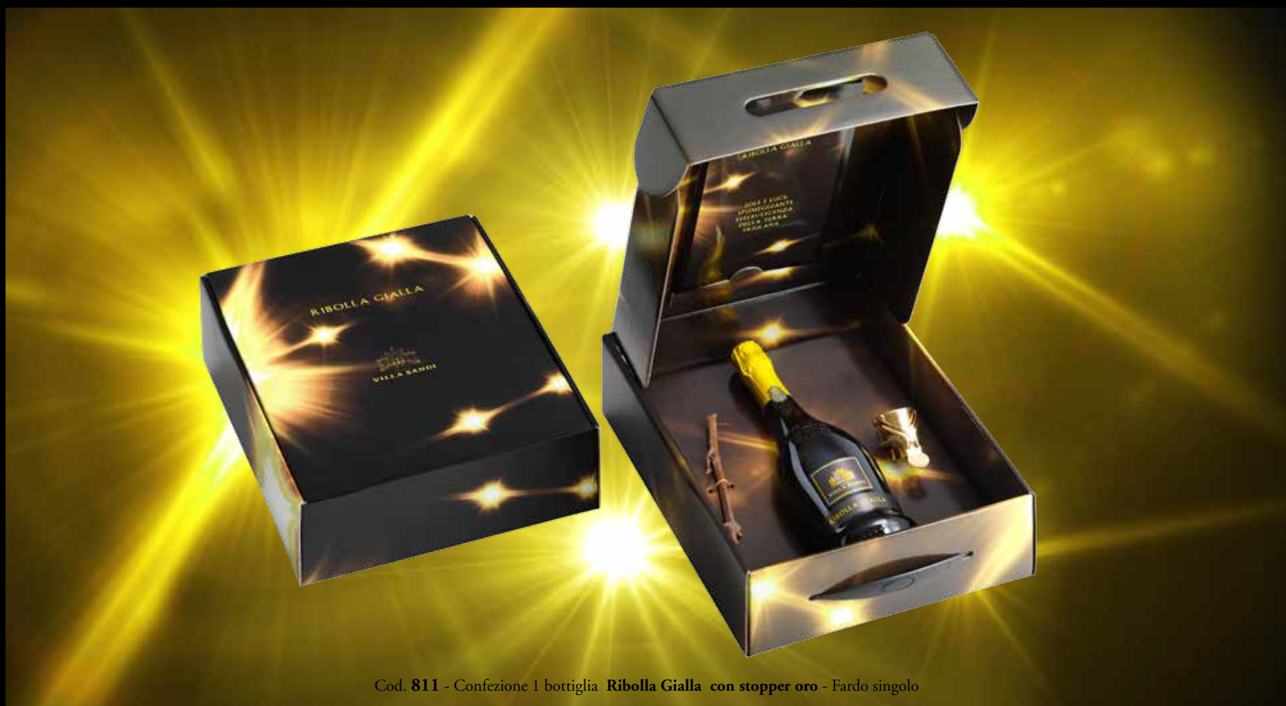
Cod. 811 - Confezione 1 bottiglia Ribolla Gialla con stopper oro - Fardo singolo