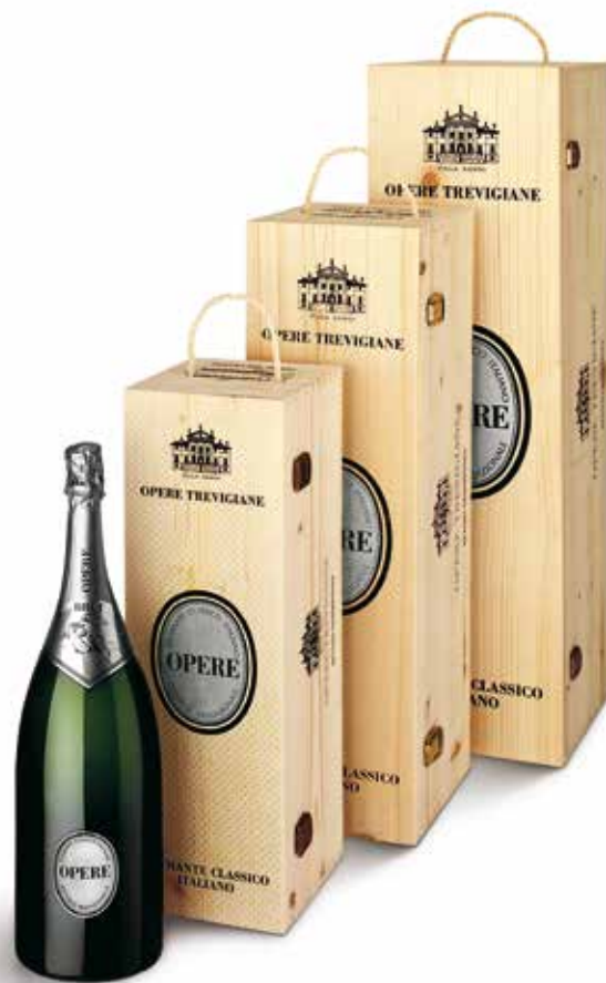
Cod. 870 - Cassa in legno Opere Brut Magnum 1,5 lt - Fardo singolo Cod. 808 - Jeroboam 3 lt - Fardo singolo / Cod. 809 - Mathusalem 6 lt - Fardo singolo