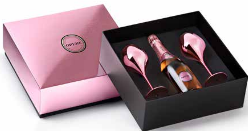
Cod. 815 - Confezione con 2 calici rosa Opere Rosé - Fardo singolo