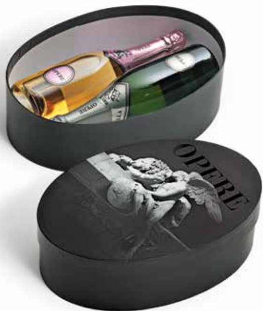
Cod. 880 - Cappelliera da 2 bottiglie Opere Brut e Rosé - Fardo singolo