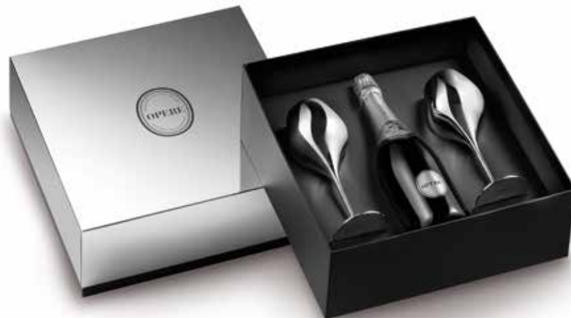
Cod. 836 - Confezione con 2 calici argento Opere Brut - Fardo singolo