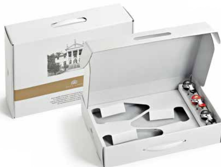
Cod. 897 - Valigetta da 3 bottiglie con stopper Fardo singolo